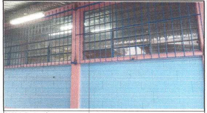
FOTO 8: Finalización de la Instalación de 13 vidrios en estructuras de metal de ventanales.