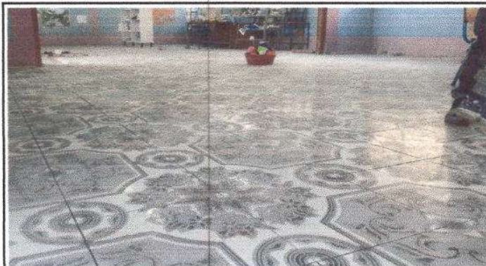
FOTO 2: Finalización de la Instalación del Piso Cerámico Cuernavaca Negro 177 m2. en dos aulas, cocina, bodega y dirección del centro educativo