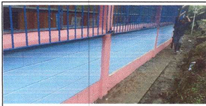
FOTO 4: Finalización del mantenimiento de 46 m2 a las estructuras de metal de los Balcones.