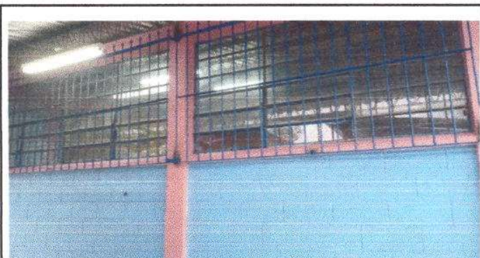
FOTO 5: Finalización de la Instalación de 9.5 m2 de Nuevos Balcones del Centro Educativo.