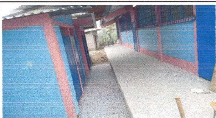
Foto 1: Finalización de la instalación del piso Granito en los corredores del centro educativo 40 m2.