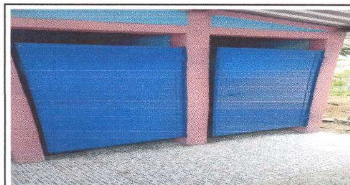
FOTO 11: Finalización al Mantenimiento de 4 puertas de Servicios Sanitarios.