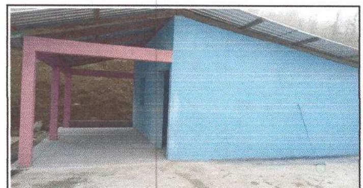
FOTO 12: Finalización de la Instalación de piso de Granito en el corredor de la Cocina Escolar. 20 m2

Observación: Si es necesario se pueden agregar hojas adicionales y actualizar el número de hojas.