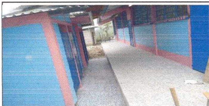
FOTO 3: Finalización de la aplicación de 504 m2 de pintura en muros Interiores y Exteriores.